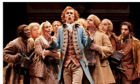
Ensemble cast in She Stoops to Conquer (Johan Persson)

契約形態: 恒久アクセスライセンス IPアドレス認証方式・同時アクセス無制限 個別にお見積り致します。お気軽にお問い合わせください。 販売総代理店: 紀伊國屋書店電子書籍営業部 pqhelp@kinokuniya.co.jp