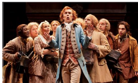
Ensemble cast in She Stoops to Conquer (Johan Persson)

契約形態: 恒久アクセスライセンス IPアドレス認証方式・同時アクセス無制限 個別にお見積り致します。お気軽にお問い合わせください。 販売総代理店: 紀伊國屋書店デジタル情報営業部 pqhelp@kinokuniya.co.jp