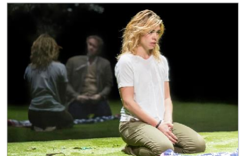
Billie Piper in Yerma