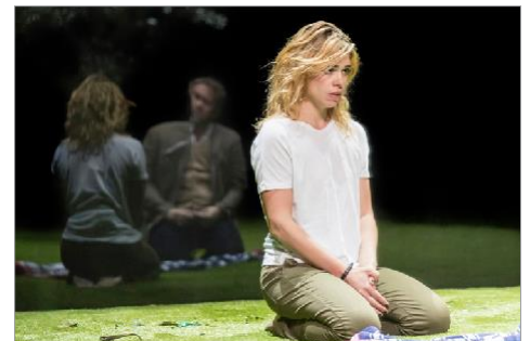
Billie Piper in Yerma

For more information, visit www.alexanderstreet.com/national-theatre