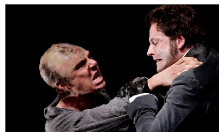
Benedict Cumberbatch and Jonny Lee Miller in Frankenstein