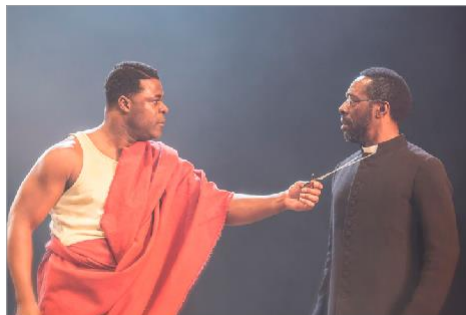
Danny Sapani and in Gary Beadle in Les Blancs