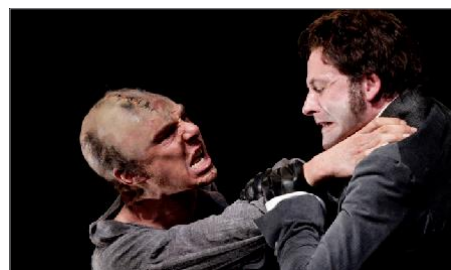
Benedict Cumberbatch and Jonny Lee Miller in Frankenstein