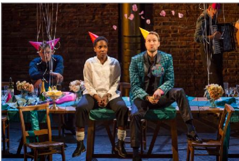
Ensemble cast in Twelfth Night