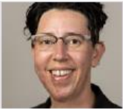
Karma Chavez Chair in the Department of Mexican American and Latina/o Studies at the University of Texas at Austin

ニューヨークとサンフランシスコのエイズ関連の活動家が重要な役割を果たした国家をまたがる組織化の2点の事例をとりあげます。