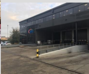
右) イギリス・ロンドンの 集荷センター