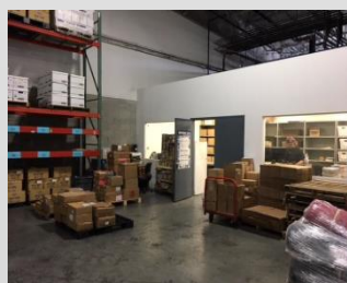
左) アメリカ・ニューヨークの 集荷センター