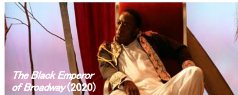
The Black Emperor of Broadway (2020)