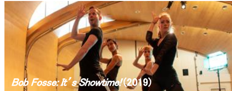
Bob Fosse: It's Showtime! (2019)