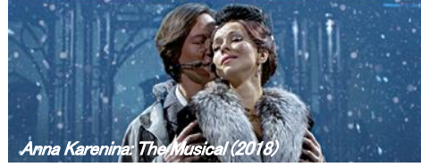
Anna Karenina: The Musical (2018)