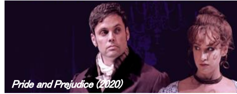
Pride and Prejudice (2020)