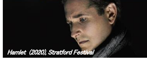
Hamlet (2020), Stratford Festival