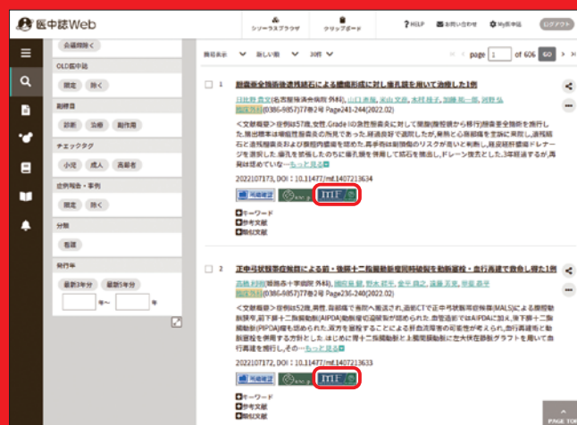
※画面はサンプルです。

医中誌Webとの相互リンク! 医中誌Webの検索結果から、 対応する論文に直接リンクしています。