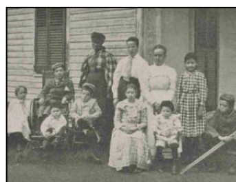
←1899年頃のニューイントン難病者グループホームの子どもたち。

ニューヨーク医学アカデミーが所蔵する4万冊以上の医療パンフレットコレクションから、障害の説明、治療法、政策、報告書、論文、機器の広告等を含む、障害に関連する3,000点強の英語パンフレットを選び収録します。19世紀から20世紀初頭の医療技術革新や研究以外に、栄養管理、適切な衛生状態、健康づくりに有効な運動などのトピックを網羅する健康関連の出版物で構成されています。