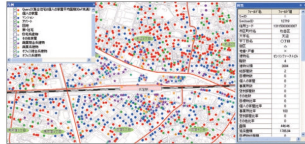
※画像はイメージです。利用されるシステムや背景図によって機能や画面イメージが異なります。

住宅ポイントデータは、建物ポイントデータの中から住宅利用の建物情報に絞ったデータを収録しているものです。