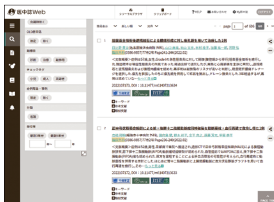
※画面はサンプルです

医中誌Webとの相互リンク! 医中誌Webの検索結果から、 対応する論文に直接リンクしています。