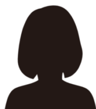
千葉県私立中高 O先生(図書館司書)

生徒たちは電子書籍へ抵抗を感じている様子もなく、利用者は予想以上に多いです。かなり迷いましたが、 導入してよかった と実感しています。