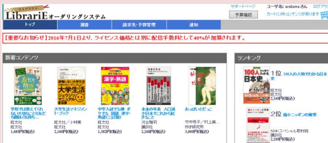
選書オーダリングシステム(選書・発注用)