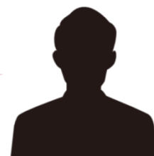
都内私立中高 N先生(司書教諭)

1人1台配布しているiPadを利用するにはうってつけと思い導入しました。これまで本には見向きもしなかった子から、興味はあるけどなかなか図書館に来られなかった子まで、 読書の機会が増えた のが良かったです。