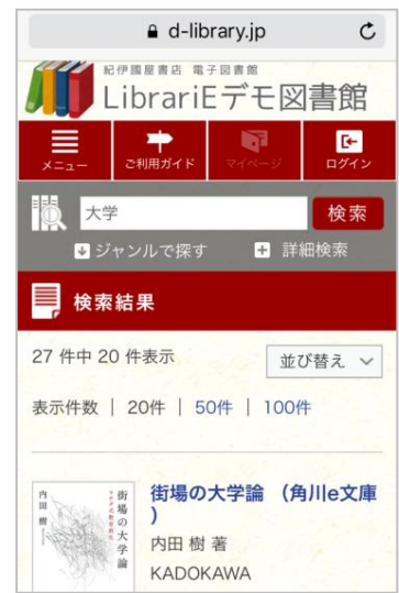
電子図書館システム(スマートフォン画面)

ブラウザ閲覧のため、ソフトや アプリを導入する必要なし！ 配布端末、自宅PC、スマート フォンから閲覧できます。