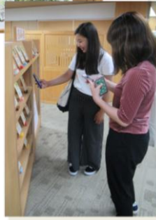
ポスター、「電子書籍の森」で学生にPR